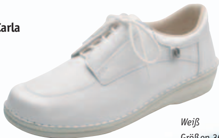
Weiß Größen 36-43 Art.-Nr. 3 783072