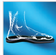
Druckverteilung durch Fußbettung

Die im Schuh befindlichen Weichpolster-Fußbettsohlen können bei allen GloboConcept Schuhen herausgenommen werden. So bietet der Schuh Platz für alle orthopädischen Einlagen.